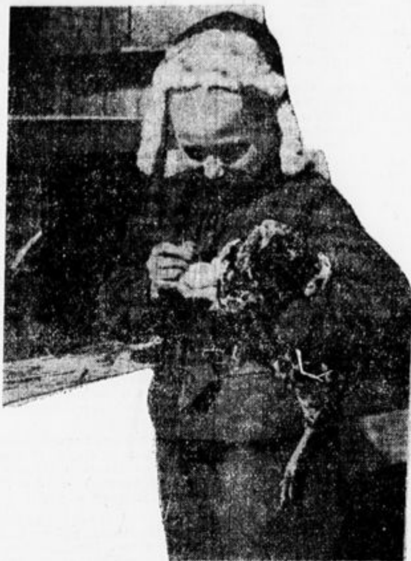
Контроль яиц. Вынимает из гнезда и записывает от какой курицы и петуха.